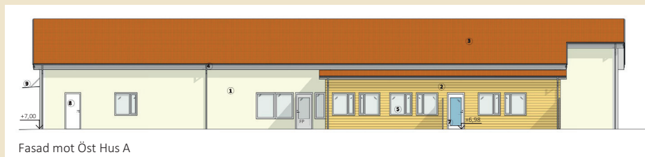
Fasad mot Öst Hus A

De ljusa och fina lägenheterna är 42,7 kvm och består av kök och vardagsrum sammanslaget i en öppen planlösning, ett sovrum samt ett rymligt badrum med toalett och dusch. Varje lägenhet har tillgång till en egen uteplats, som även kan användas som en alternativ ingång. För högsta möjliga komfort har alla lägenheter golvvärme.